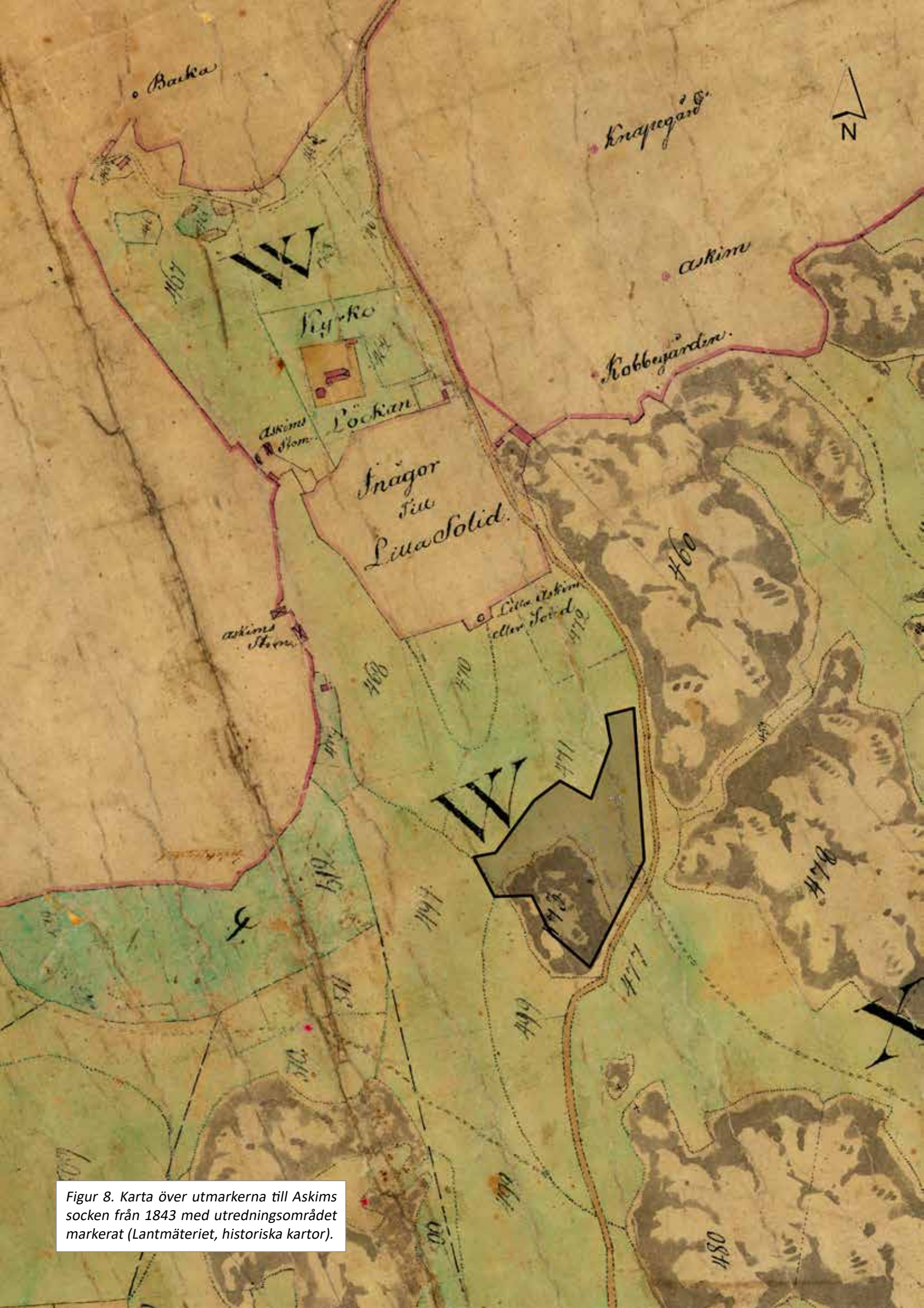
Figur 8. Karta över utmarkerna till Askims socken från 1843 med utredningsområdet markerat (Lantmäteriet, historiska kartor).