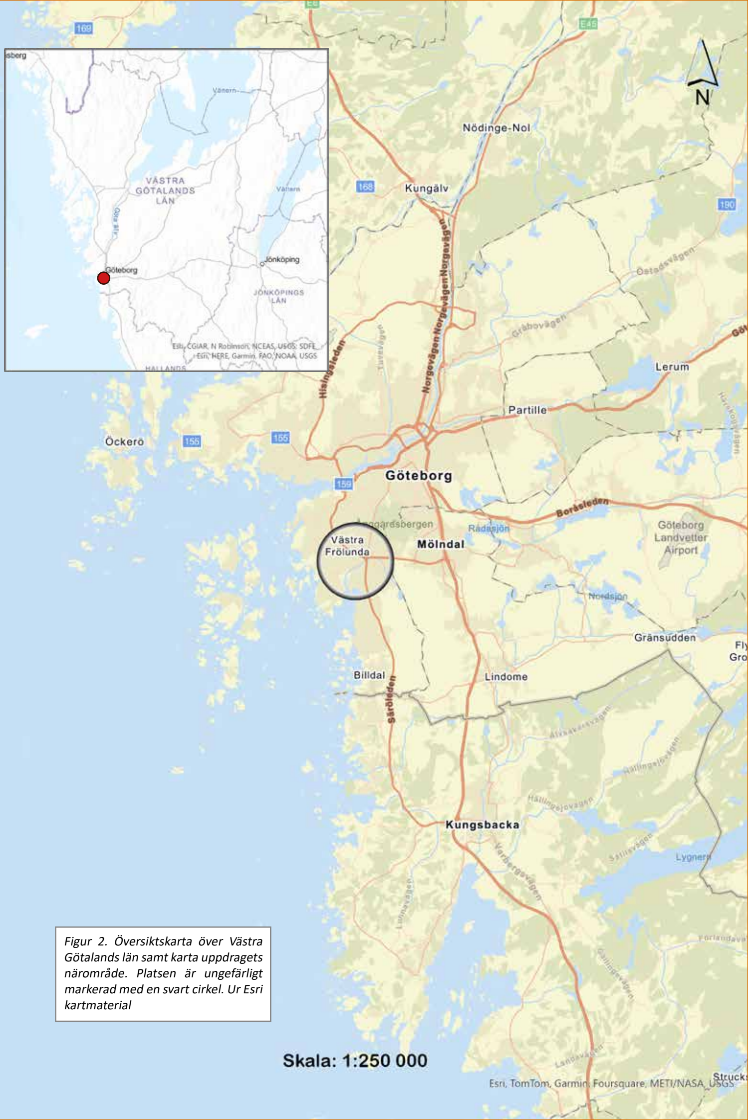
Figur 2. Översiktskarta över Västra Götalands län samt karta uppdragets närområde. Platsen är ungefärligt markerad med en svart cirkel.