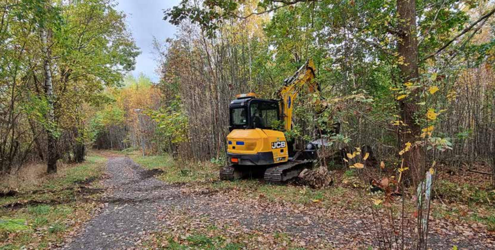
Figur 1. Schaktning i de centrala delarna av utredningsområdet där det även fanns ett elljusspår. Foto mot sydväst, Johanna Lega.