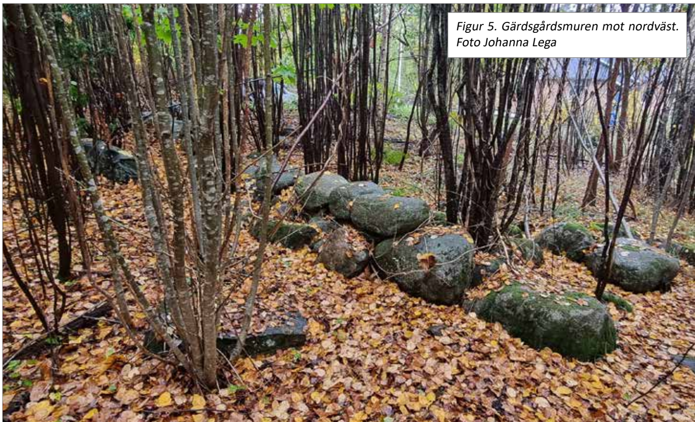
Figur 5. Gärdsgårdsmuren mot nordväst.